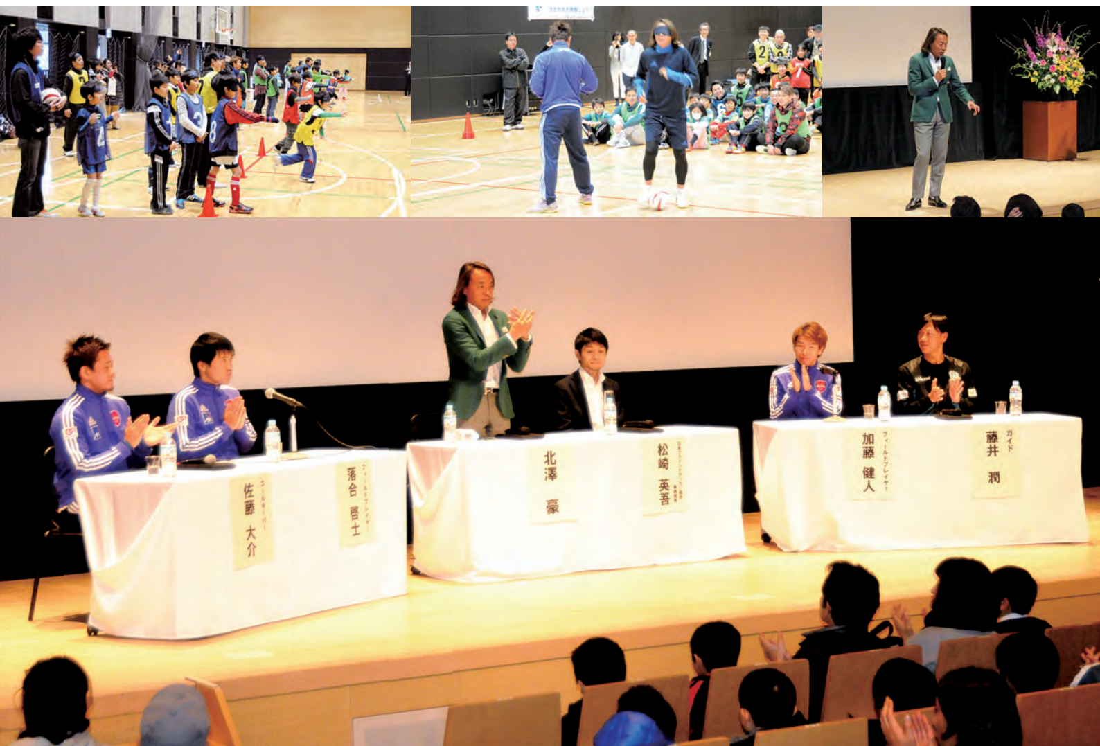
ブラインドサッカー 体験会・講習会 (平成 28 年 2 月 6 日)

公益財団法人品川区スポーツ協会は、品川区における体育、スポーツ及びレクリエーションの普及振興を図り、誰もが気軽にスポーツを楽しめる機会を提供し、区民の心身の健全な発達と明るく豊かな地域社会の形成に寄与することを目的としています。