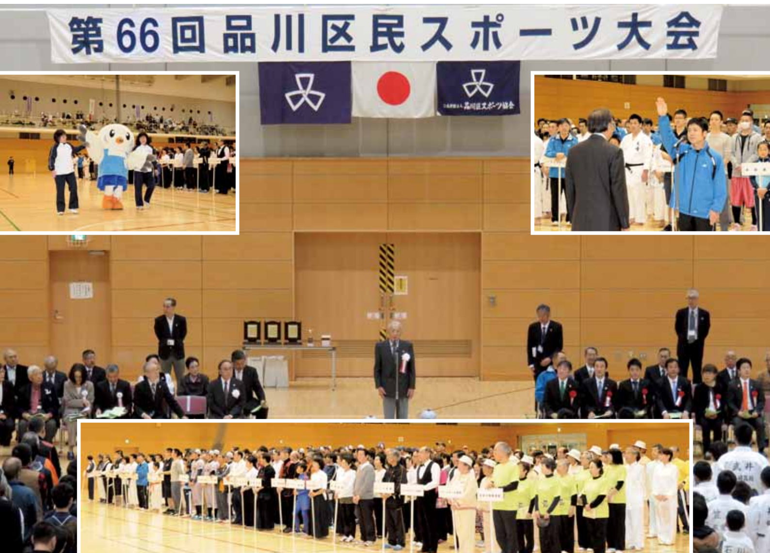
第 66 回 品川区民スポーツ大会開会式

公益財団法人品川区スポーツ協会は、品川区における体育、スポーツ及びレクリエーションの普及、振興を図り、誰もが気軽にスポーツを楽しめる機会を提供し、区民の心身の健全な発達と明るく豊かな地域社会の形成に寄与することを目的としています。