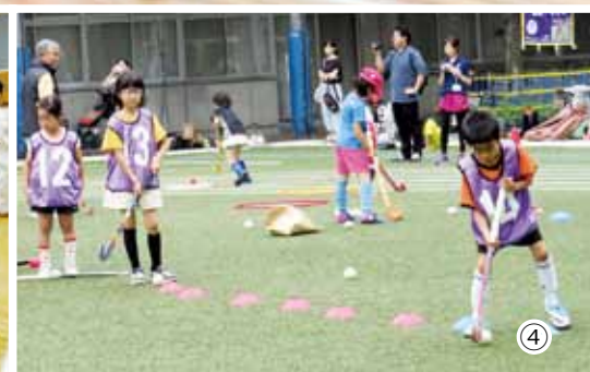
真剣に取り組みました (①新体操教室 ②ジュニア弓道教室 ③8種目体験(空手道) ④ホッケー教室)