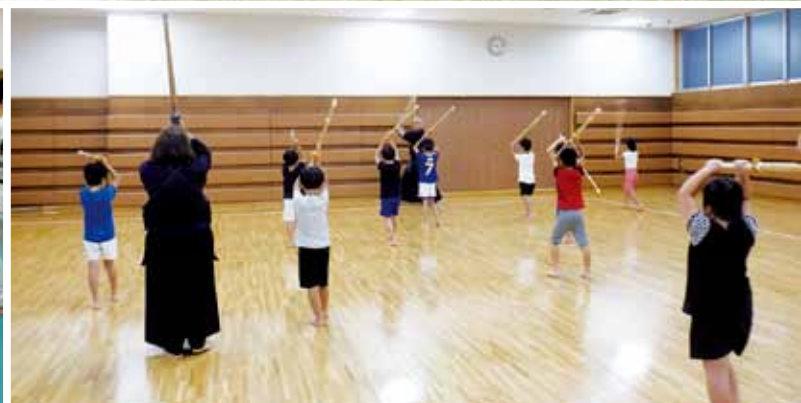
8種目体験教室(サッカー・柔道・剣道)