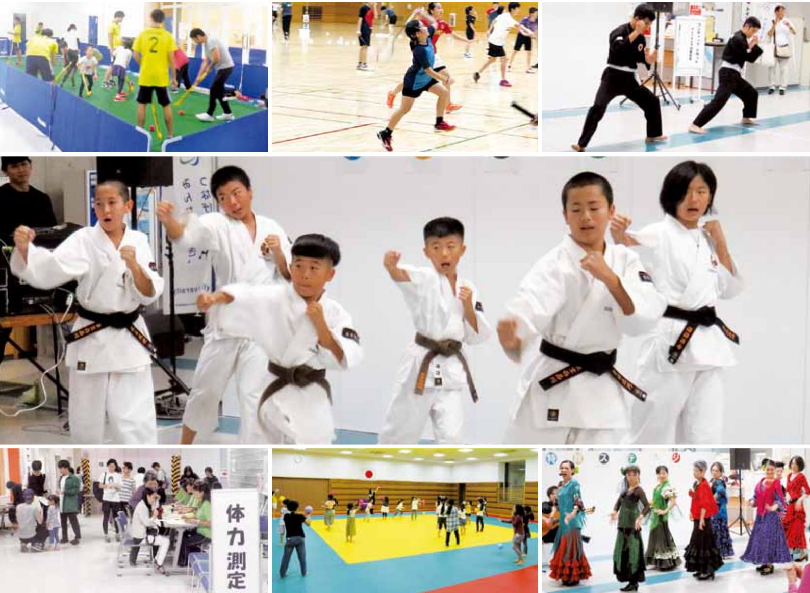
体育の日記念事業〈令和元年10月14日〉

公益財団法人品川区スポーツ協会は、品川区における体育、スポーツ及びレクリエーションの普及、振興を図り、誰もが気軽にスポーツを楽しめる機会を提供し、区民の心身の健全な発達と明るく豊かな地域社会の形成に寄与することを目的としています。