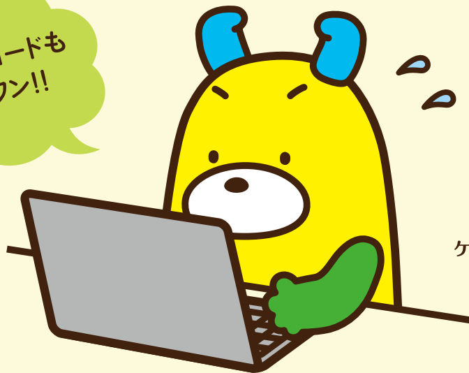
ケーブルテレビ品川キャラクター シナガワン