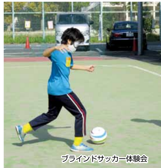
ブラインドサッカー体験会