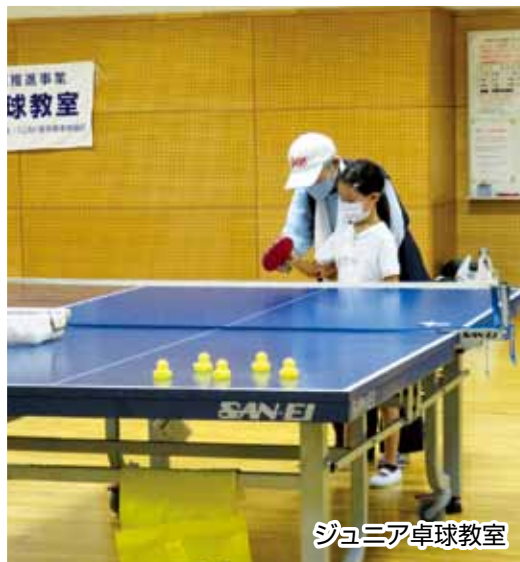
ジュニア卓球教室