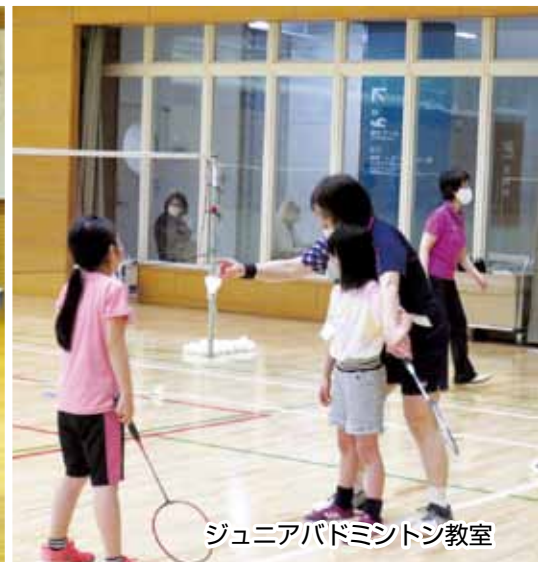
ジュニアバドミントン教室