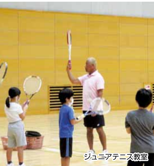
ジュニアテニス教室

公益財団法人品川区スポーツ協会は、品川区におけるスポーツ及びレクリエーションの普及、振興を図り、誰もが気軽にスポーツを楽しむ機会を提供し、区民の心身の健全な発達と明るく豊かな地域社会の形成に寄与することを目的としています。