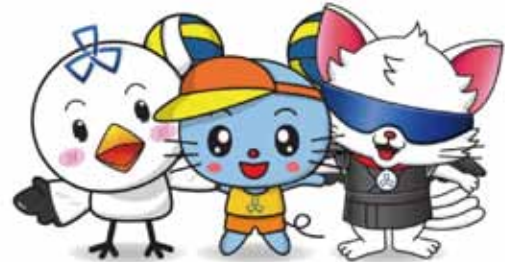
ホッケー応援 シナカモン ビーチバレーボール応援 ビーチユウ ブラインドサッカー応援 やたたま