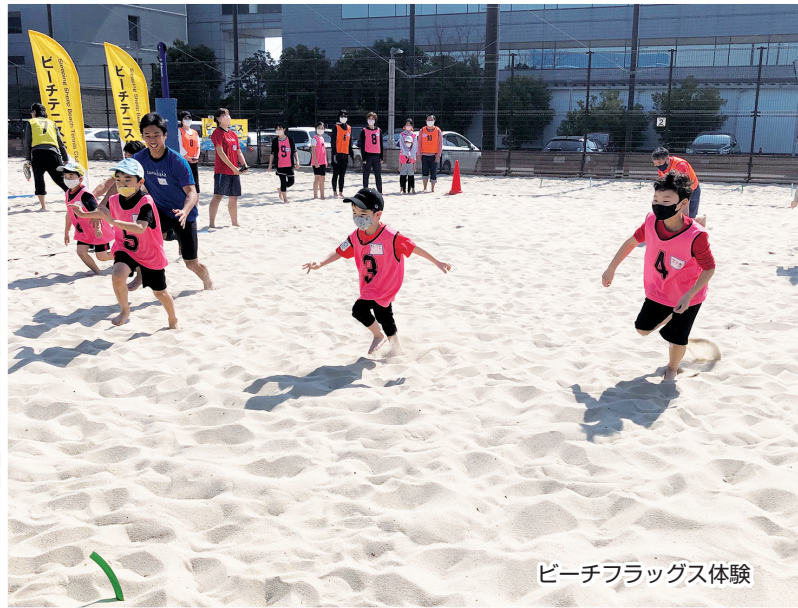
ビーチフラッグス体験