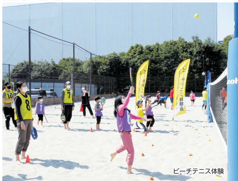
ビーチテニス体験