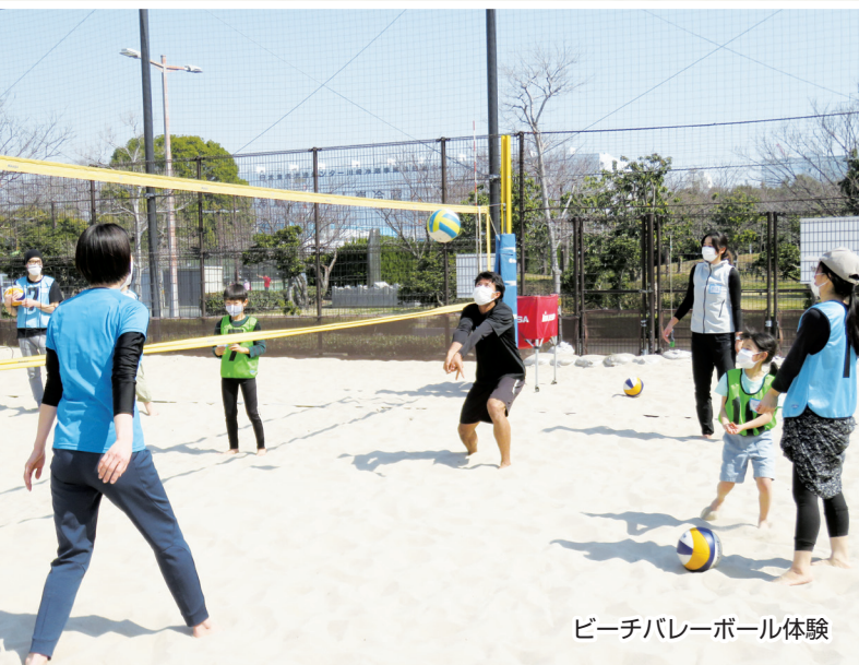
ビーチバレーボール体験