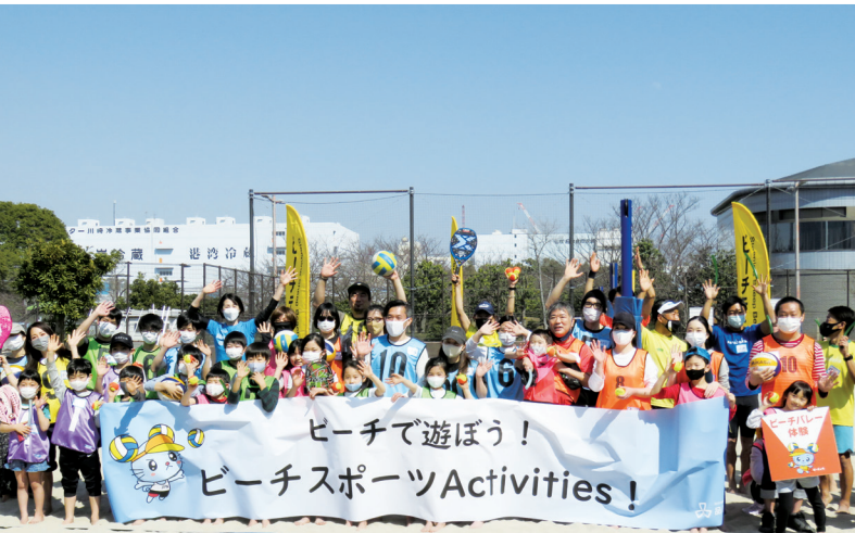
ビーチスポーツ体験教室参加者

公益財団法人品川区スポーツ協会は、品川区におけるスポーツ及びレクリエーションの普及、振興を図り、誰もが気軽にスポーツを楽しめる機会を提供し、区民の心身の健全な発達と明るく豊かな地域社会の形成に寄与することを目的としています。