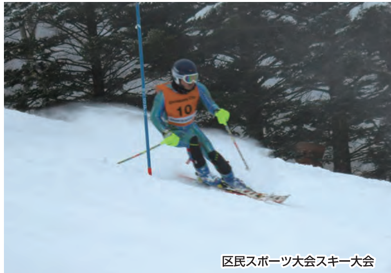
区民スポーツ大会スキー大会