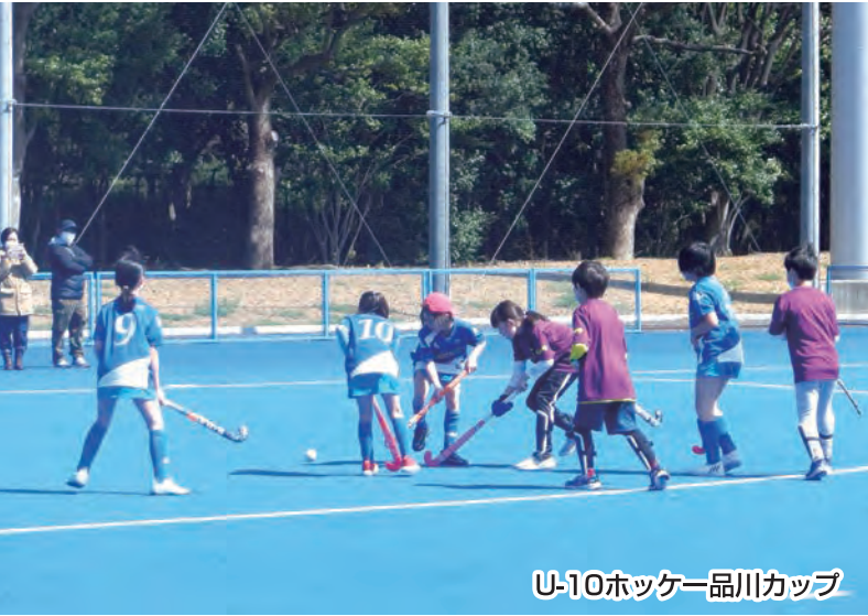
U-10ホッケー品川カップ

公益財団法人品川区スポーツ協会は、品川区におけるスポーツ及びレクリエーションの普及、振興を図り、誰もが気軽にスポーツを楽しめる機会を提供し、区民の心身の健全な発達と明るく豊かな地域社会の形成に寄与することを目的としています。