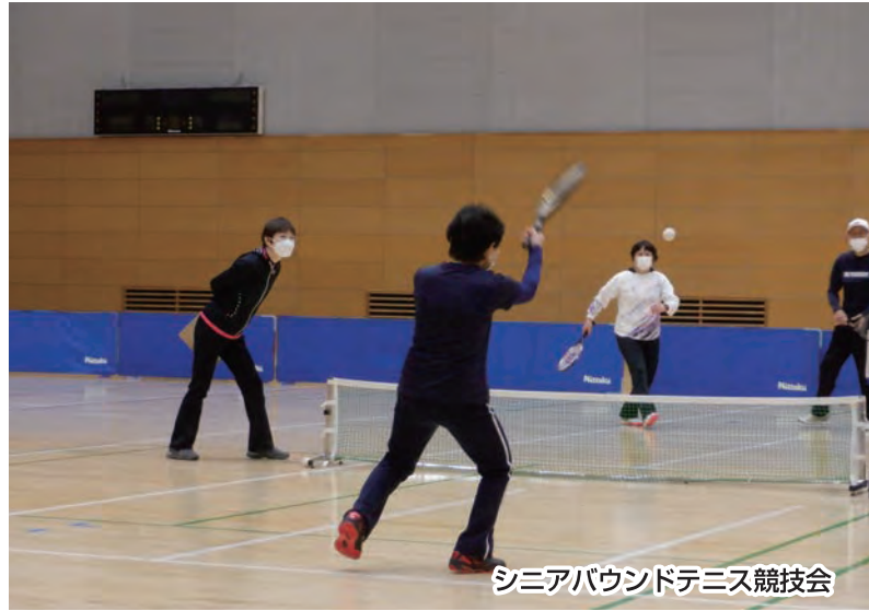
シニアバウンドテニス競技会