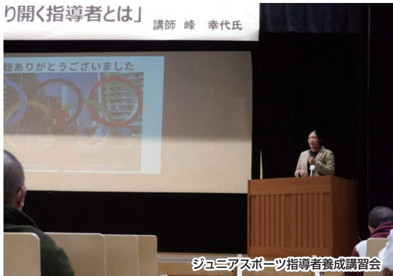
ジュニアスポーツ指導者養成講習会