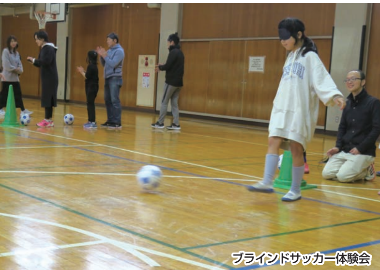
ブラインドサッカー体験会