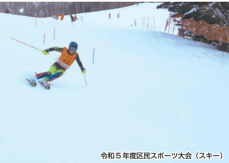
令和5年度区民スポーツ大会(スキー)

公益財団法人品川区スポーツ協会は、品川区におけるスポーツ及びレクリエーションの普及、振興を図り、誰もが気軽にスポーツを楽しめる機会を提供し、区民の心身の健全な発達と明るく豊かな地域社会の形成に寄与することを目的としています。