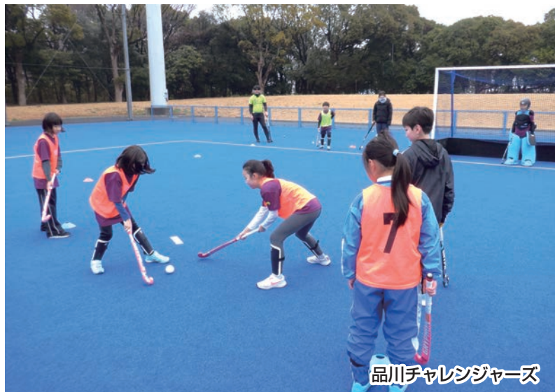
品川チャレンジャーズ