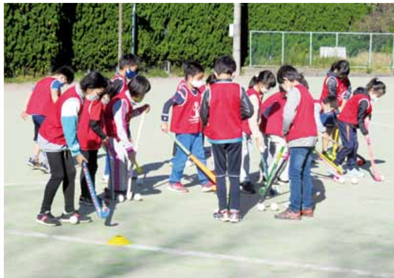
ジュニア育成地域推進事業 (令和2年) 他