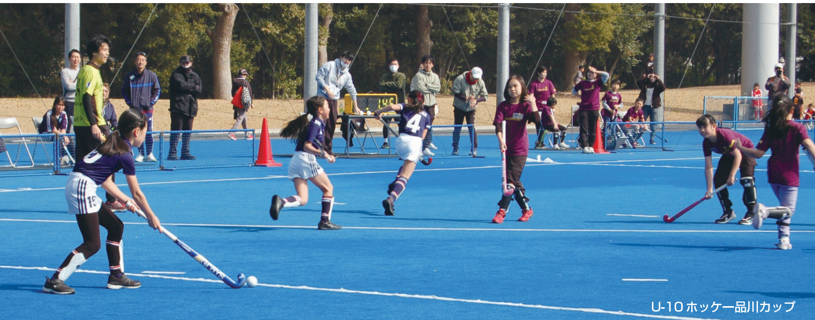
U-10 ホッケー品川カップ

公益財団法人品川区スポーツ協会は、品川区におけるスポーツ及びレクリエーションの普及、振興を図り、誰もが気軽にスポーツを楽しめる機会を提供し、区民の心身の健全な発達と明るく豊かな地域社会の形成に寄与することを目的としています。