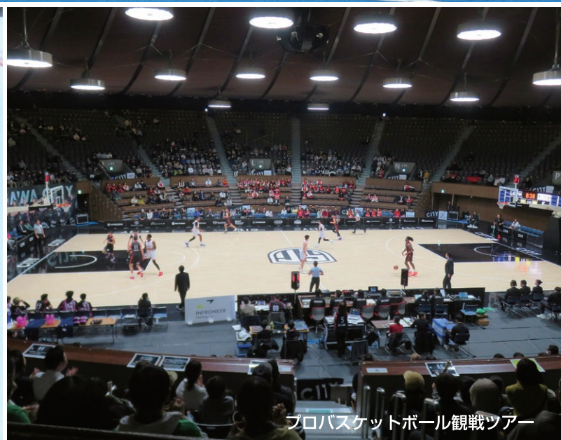
プロバスケットボール観戦ツアー