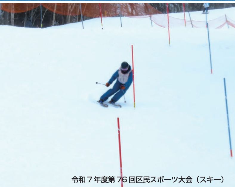
令和 7 年度第 76 回区民スポーツ大会 (スキー)